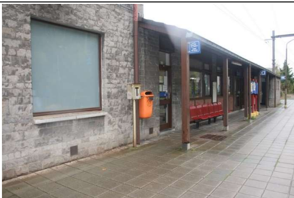
Quai partiellement couvert