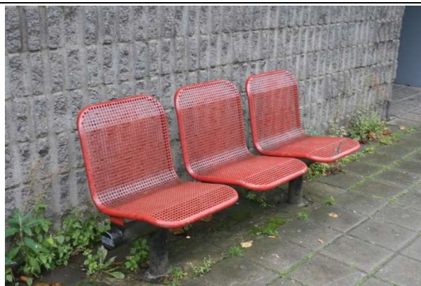
Sièges sur les quais