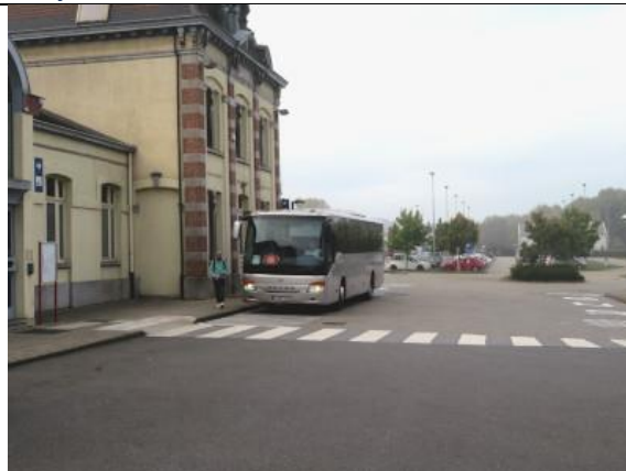
Un bus de remplacement vers Athus, bien à l'heure.