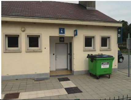
Les toilettes sont situées côté quai dans l'annexe