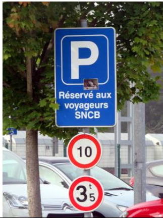
Parking SNCB bien identifié, mais toujours gratuit