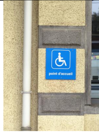
Pictogramme point d'accueil PMR