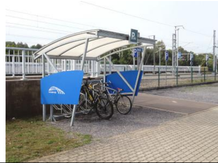
Abri pour le stationnement des vélos