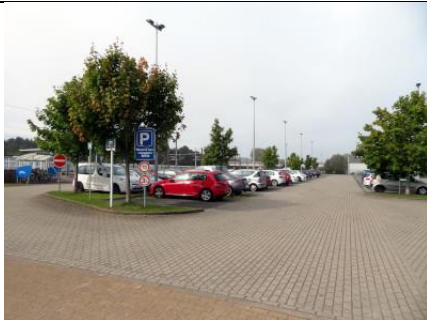
Une vue partielle du parking de la gare