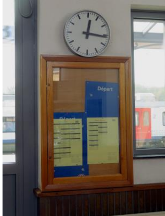
Affiches jaunes dans la salle d'attente