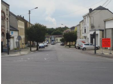
La gare, visible dans le fond, au bas de l'Avenue Bouvier