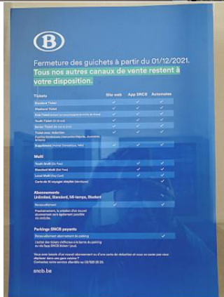
Affiche annonçant la fermeture du guichet