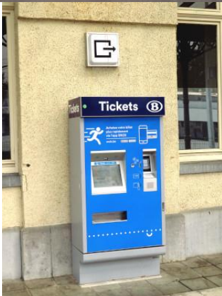
A Virton, il n'y a plus que l'automate pour acheter un billet