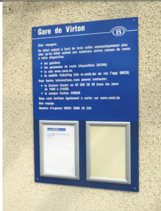
L'affiche renseigne un guichet toujours ouvert !