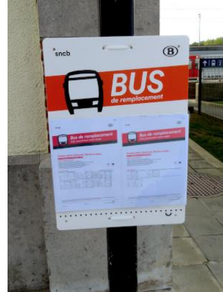
Affiche concernant les bus de remplacement