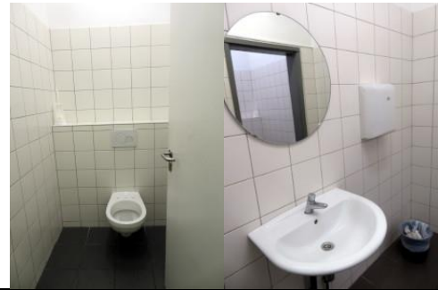
Propreté OK mais il manque la planche chez les hommes