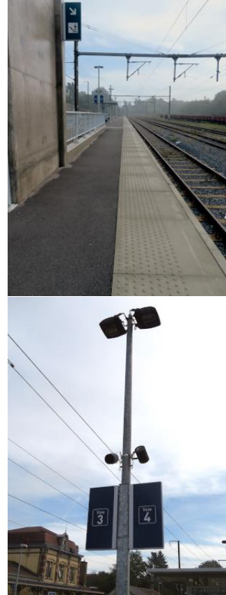
Eclairage LED, haut-parleurs et indicateurs de quai