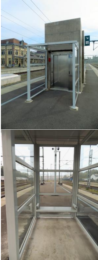
Nouvel abri de quai avec banc, entre les voies 3 et 4