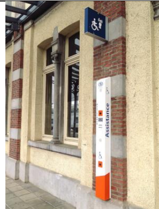
La borne d'assistance PMR