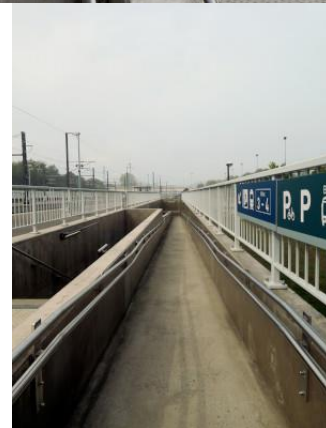
La longue rampe favorise l'accès PMR au couloir sous voies