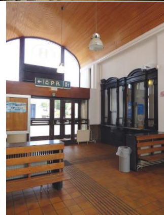
Vue de la salle d'attente toujours ouverte