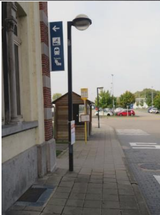
Signalétique SNCB et abri du TEC devant la gare