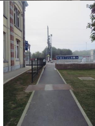
Accès aux quais à droite du bâtiment