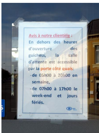
Affiche toujours en place alors que le guichet est fermé depuis 10 mois...