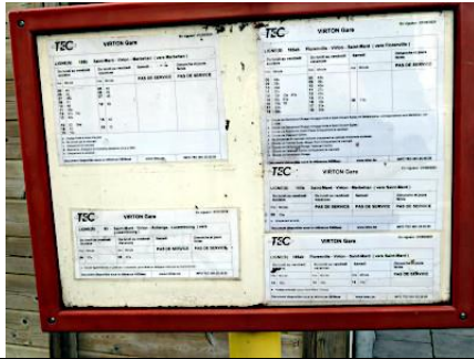
Une partie des horaires du TEC affichés