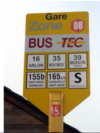
Lignes du TEC desservant la gare