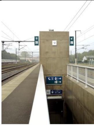
Pictogrammes à hauteur de cage d'ascenseur