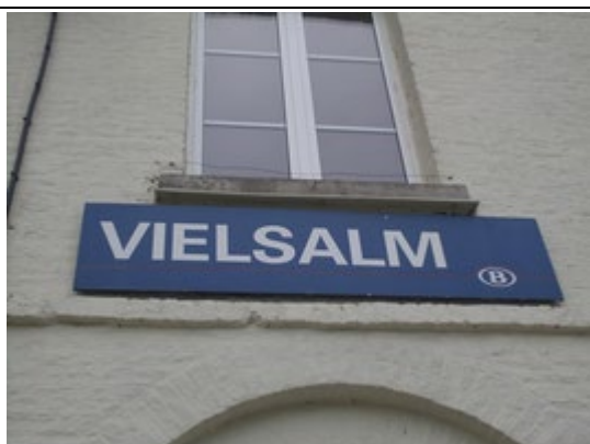
Panneau de dénomination sur le bâtiment