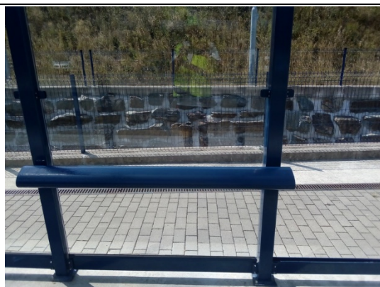
Bancs dans les abris