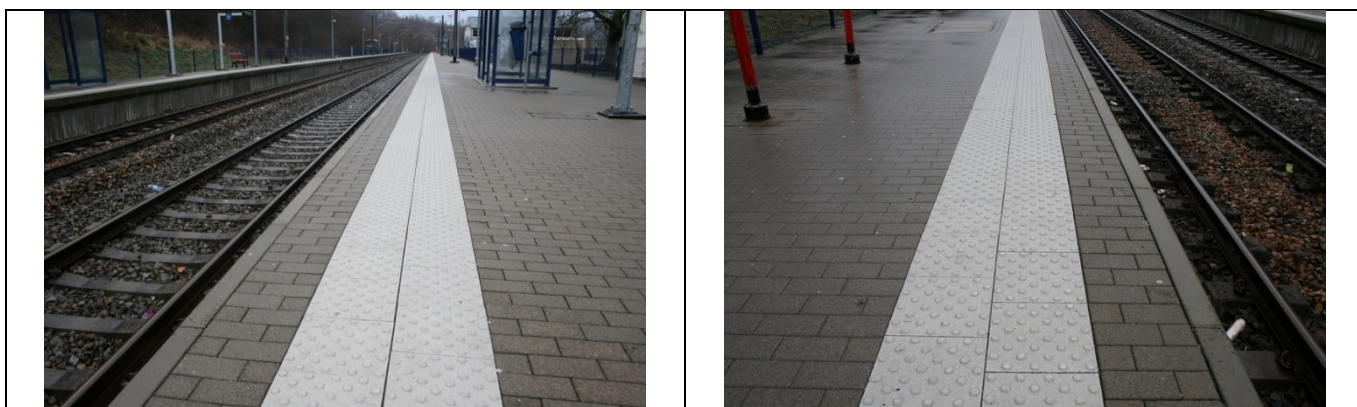
Le revêtement des quais