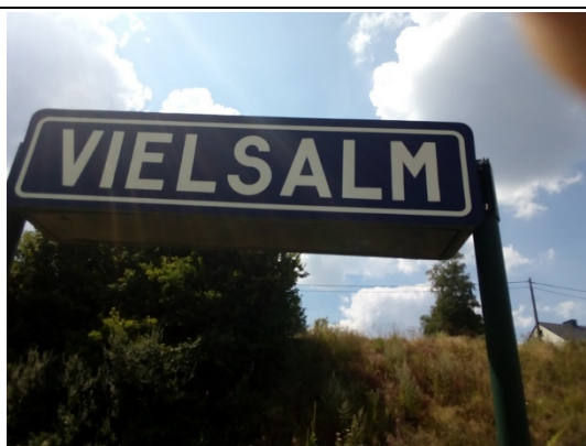
Panneaux de dénomination sur les quais