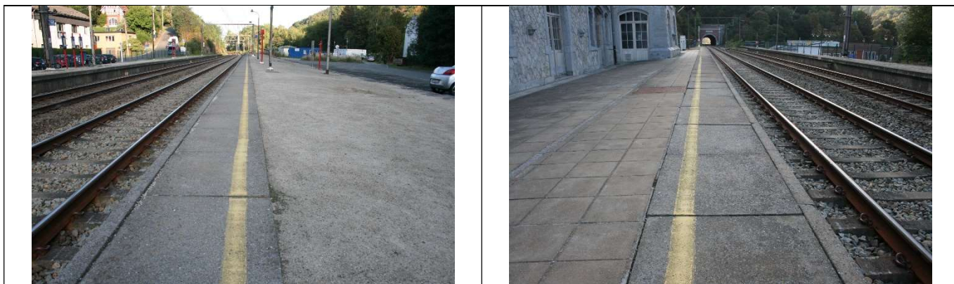
Le revêtement des quais