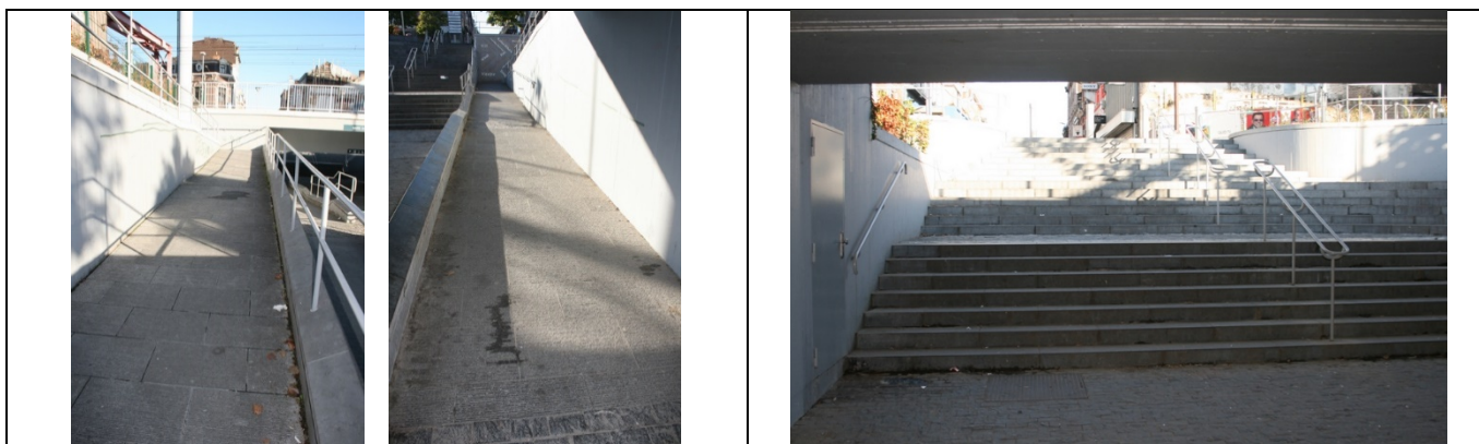
Accès au couloir sous-voies