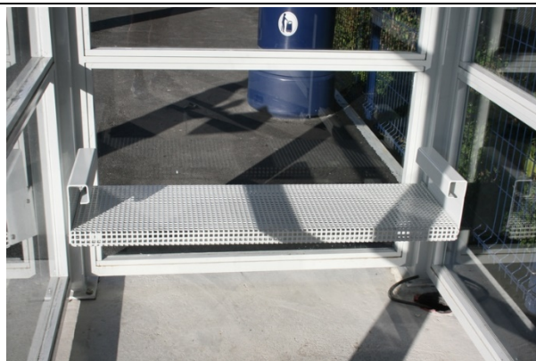
Sièges dans les abris