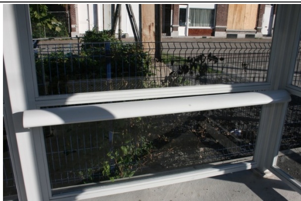
Barres d'appui dans les abris