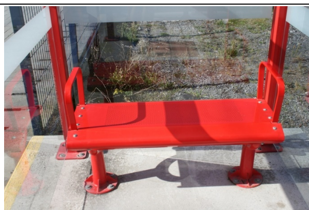
Bancs dans les abris