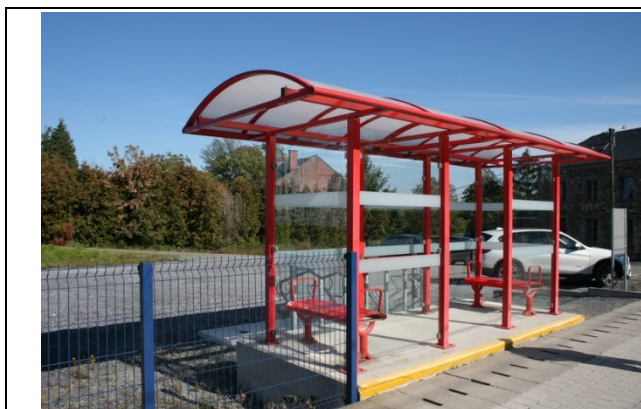
Abris sur les quais