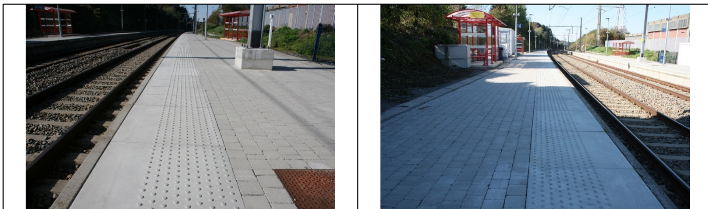
Revêtement des quais