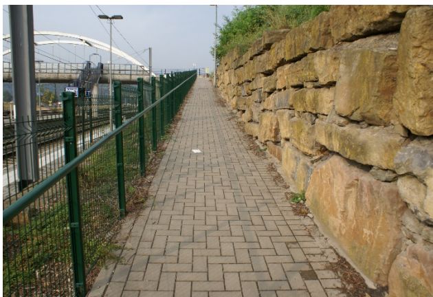
Accès PMR possible quai 1.