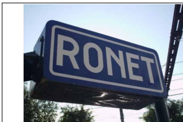
Panneaux de dénomination éclairés