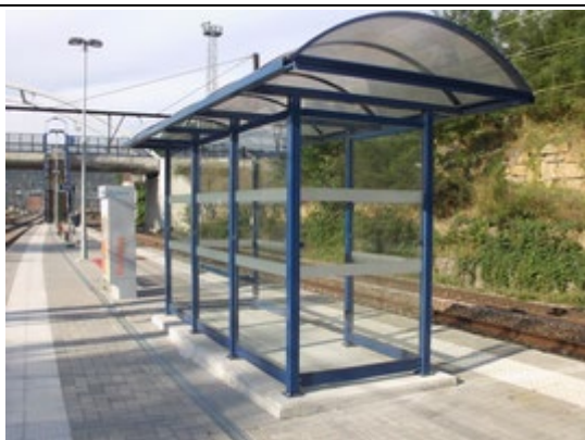
Abri sur les quais