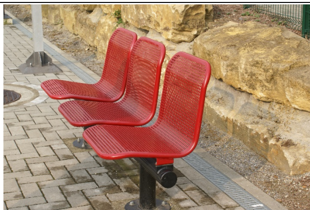
Sièges sur les quais