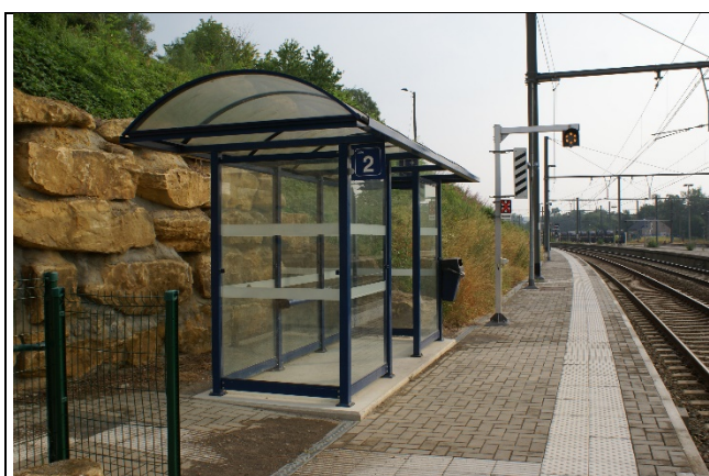
Revêtement des quais