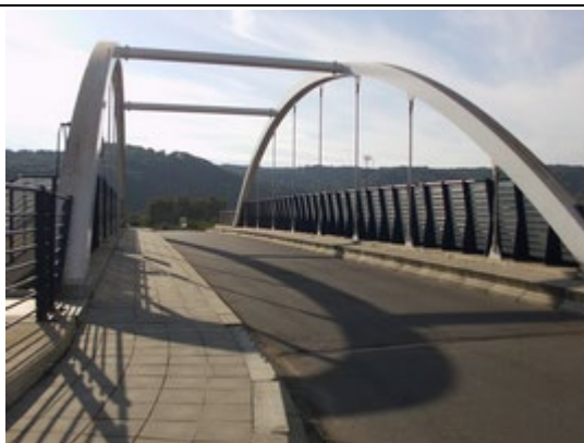
Pont au-dessus des voies