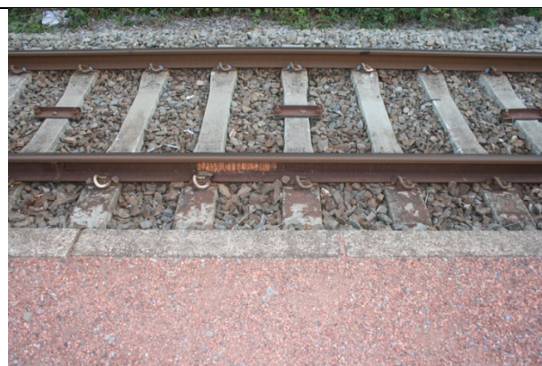
Absence de dalles podotactiles