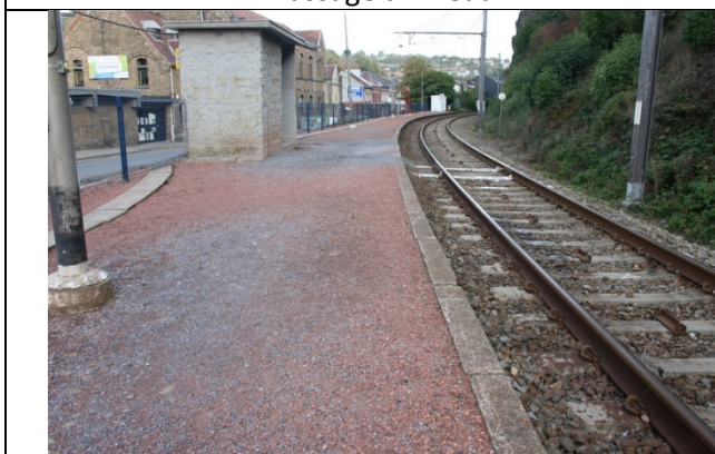
Revêtement du quai