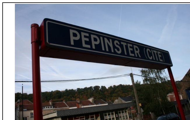
Panneaux sur le quai