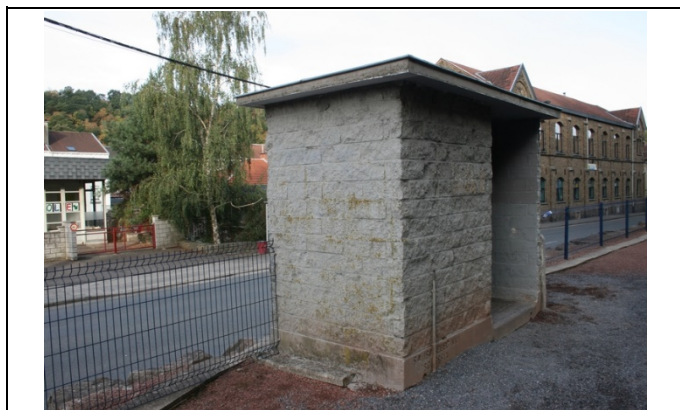
Abri sur le quai

Des éclairages et des haut-parleurs sont disposés sur le quai.