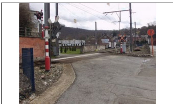
Passage à niveau