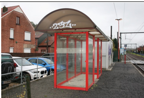
Abris sur les quais