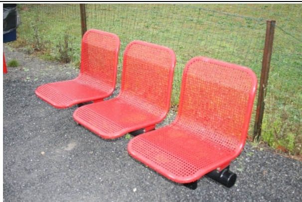
Sièges sur les quais