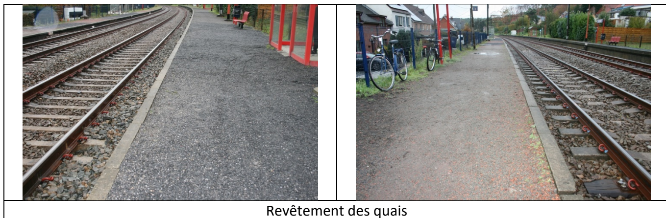
Revêtement des quais