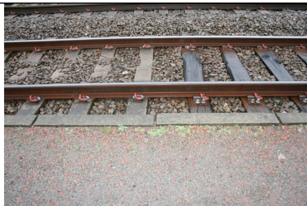
Absence de dalles podotactiles