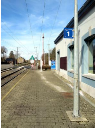
Indicateur du numéro de quai