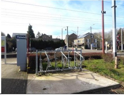
Six places de stationnement pour les vélos