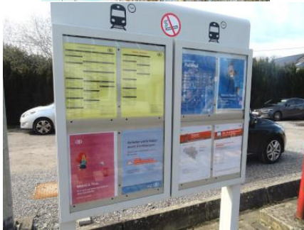
Panneau moderne avec toutes les infos sur le service SNCB