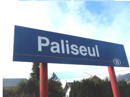
Le nom de la gare est annoncé par des panneaux sur chaque quai