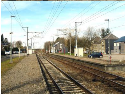
Vue générale du quai 2, prise du côté Bertrix