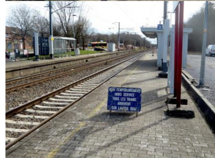
Vue générale du quai 2, prise du côté Gedinne