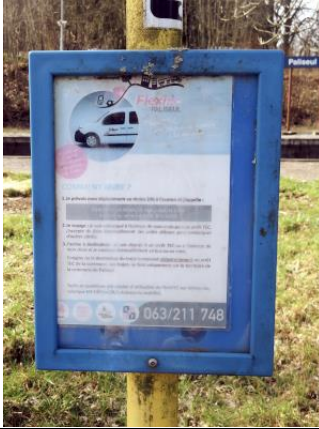
Vieux panneau TEC annonçant l'expérience de Flexibus