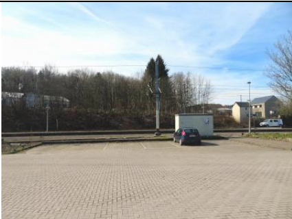
D'autres places de parking sur le gravier le long de la voie 2 ?