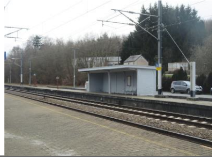
Ce même abri vu du quai opposé