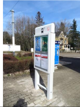
Panneau afficheur et automate à l'entrée de la gare, voie 1