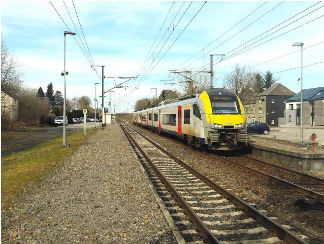
[Le 17 mars 2023, arrivée en gare de Paliseul du train L 6060 (Namur 10.52 – Libramont 12.47, via Dinant et Bertrix), la Desiro 08530 étant à la manœuvre...]

La transformation de l'ancien bâtiment de gare et son aménagement écologique par une association cherchant à mettre en valeur la mobilité au niveau du point d'arrêt représentent une amélioration substantielle qui doit être mise en avant. Elle ne sautera pas aux yeux du voyageur occasionnel ; pour les habitants de la localité et des villages avoisinants, en revanche, elle est rassurante et apporte la preuve vivante que la ruralité ne doit pas être une fatalité. S'il s'est bien informé préalablement à sa visite, le touriste y trouvera son compte également.