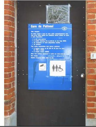
L'automate - une machine - est aujourd'hui à Paliseul la seule interaction active avec la SNCB...