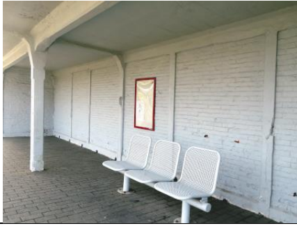
Abri et banc le long de la voie 2