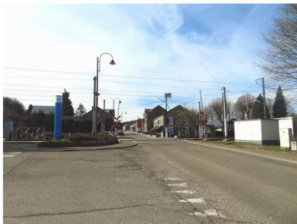
[Le passage à niveau n°4 bordant le PANG de Paliseul, où la N899 croise la ligne 166 (Dinant-Bertrix)]