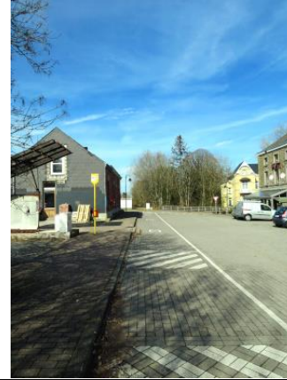
Les bus s'arrêtent sur la place à proximité de la voie 1