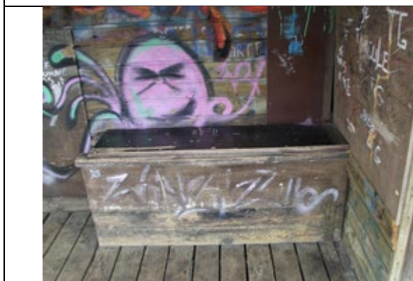
Banc en bois