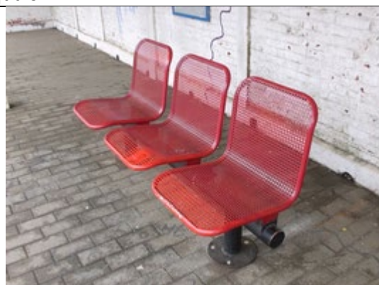
Sièges en métal

Des éclairages et des haut-parleurs sont disposés sur les quais.