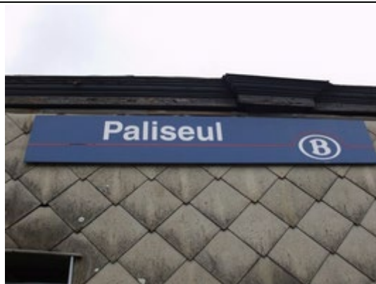
Panneau sur le bâtiment