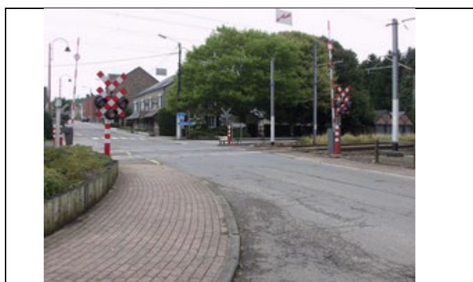
Passage à niveau