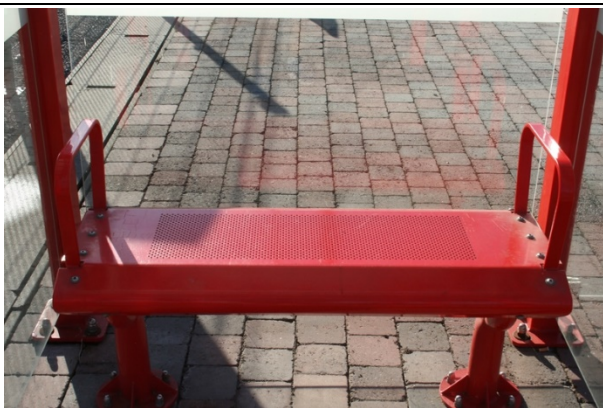
Sièges dans les abris