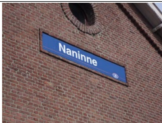
Panneau sur le bâtiment