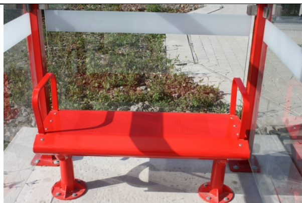
Sièges dans les abris