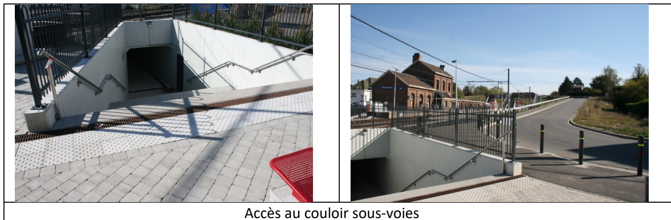
Accès au couloir sous-voies