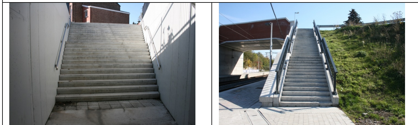
Accès aux quais