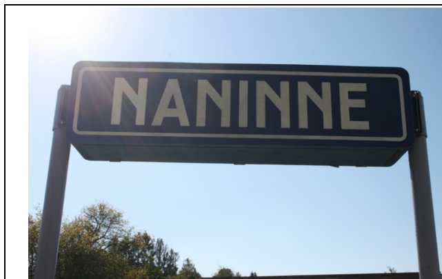
Panneaux sur les quais