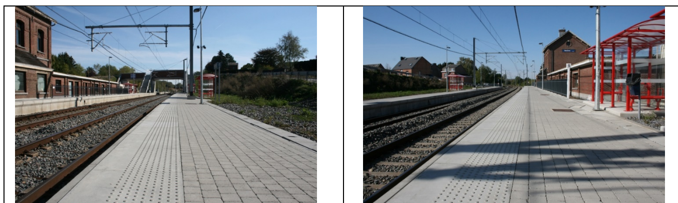
Revêtement des quais