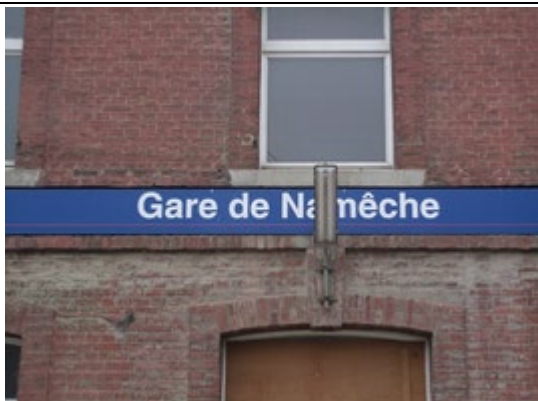
Panneau sur le bâtiment