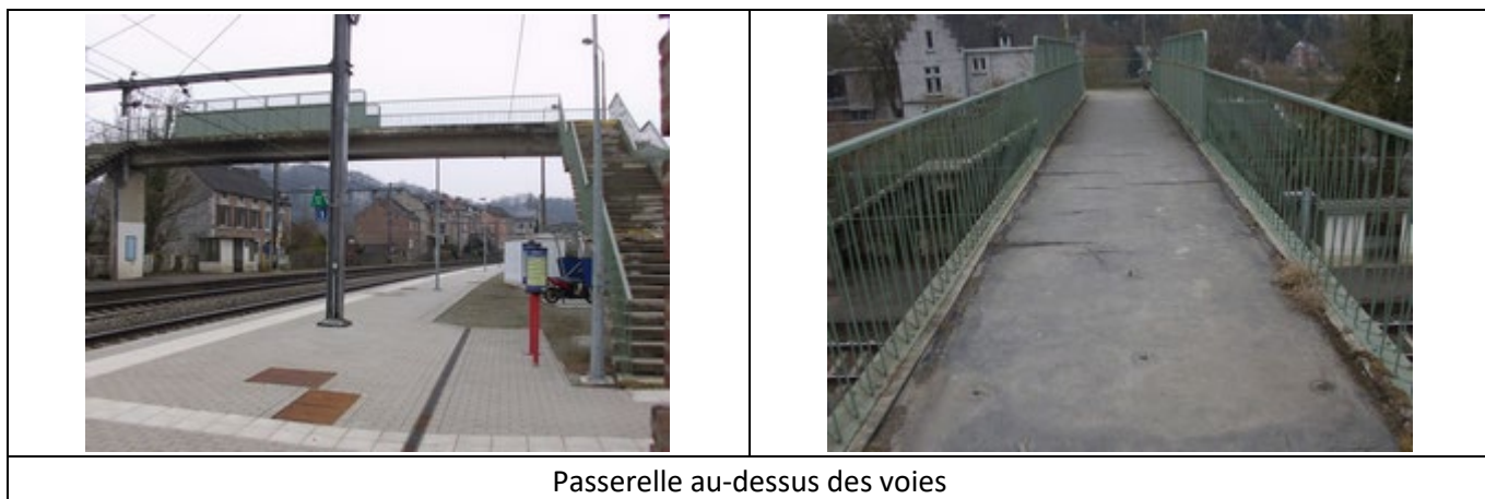
Passerelle au-dessus des voies