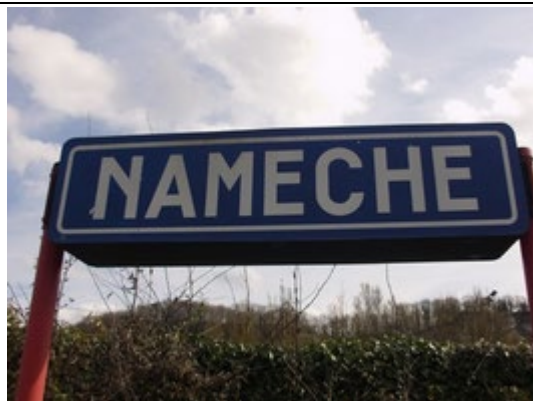
Panneaux sur les quais