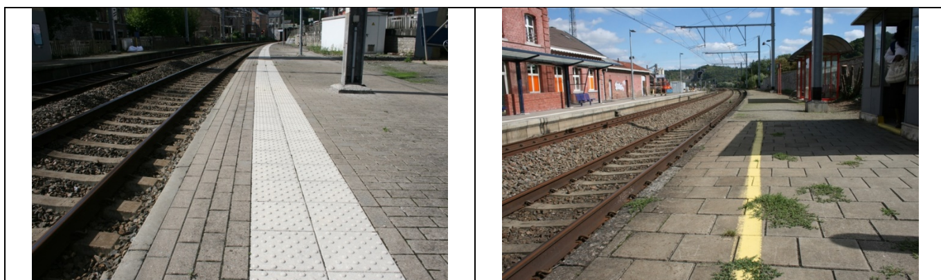
Revêtement des quais