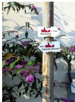
Ceci ne sont pas des itinéraires de promenade