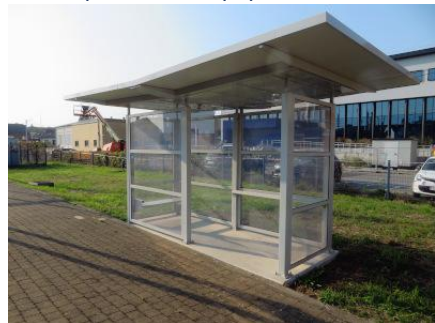
Nouvel abri de quai, voie 1