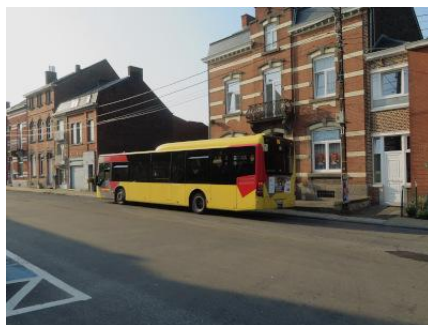
Le bus 76 du TEC s'arrête sur la Place de la Gare