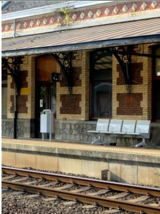
Banc et poubelle sous la marquise, voie 1