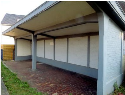
Abri de quai historique, voie 2