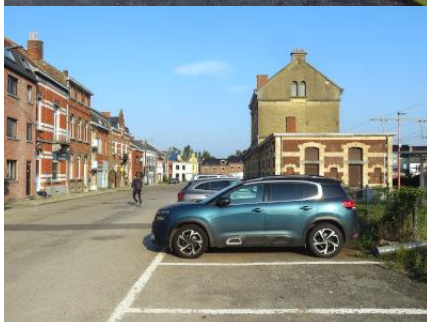
Places de stationnement sur la droite du bâtiment de gare