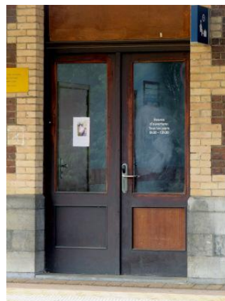
Sur le quai, un autocollant sur la porte d'entrée du bâtiment semble préciser les heures d'ouverture de la salle d'attente