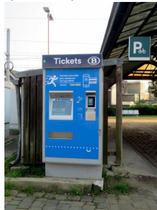
Pour toute affaire en gare aujourd'hui, il faut passer par l'automate !