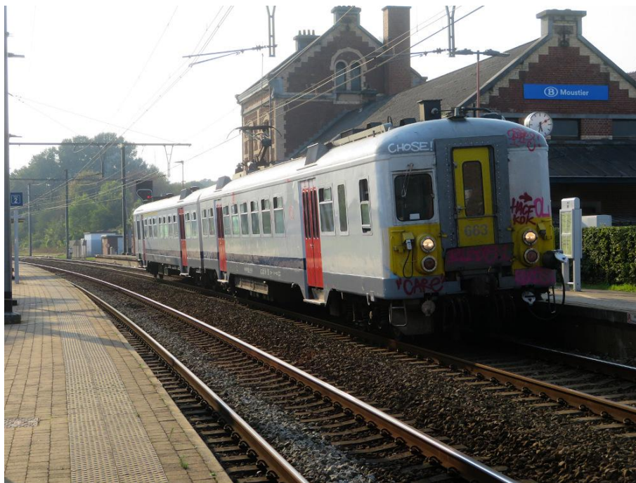
[A quelques semaines seulement de sa mise en parc après une très longue carrière, l'automotrice dite classique 663, arrive en gare de Moustier le 19 septembre 2024. Elle assure le train S61 4166 (Charleroi-Central 16h54 – Jambes 17h53).]

Fondamentalement, la morphologie du point d'arrêt est fort inégale voire ingrate. On ne s'en rendra pas immédiatement compte, mais il comble un dénivelé important entre, d'une part, la Place de la Gare et son quartier résidentiel, et d'autre part des terrains en bord de Sambre affectés à l'industrie depuis toujours. Il est également situé au sortir d'une longue courbe quand on voyage depuis Namur. Le couloir sous voies, dont l'emplacement excentré peut étonner, rend la différence de niveau imperceptible, et l'ancien bâtiment de gare, qu'il faudrait classer, ancre le point d'arrêt dans son environnement avec énormément d'aplomb.