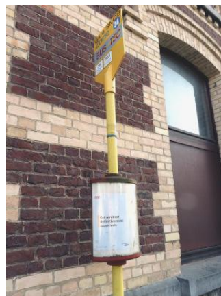
L'arrêt situé juste au pied du bâtiment de gare étant, lui, « définitivement supprimé »