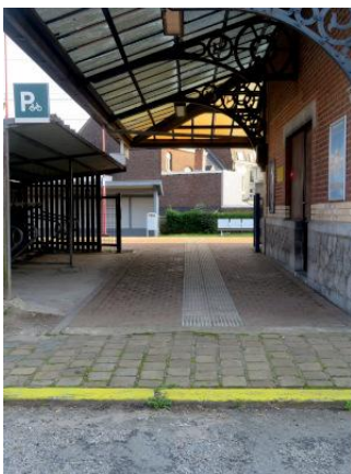
Accès à la voie 1, à gauche du bâtiment de gare