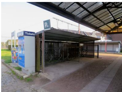
Abri pour le stationnement de douze deux-roues