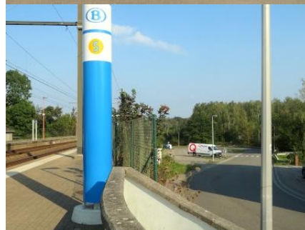
Parking en contrebas de la voie 2