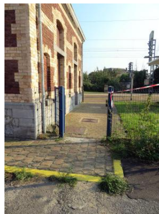
Accès à la voie 1, à droite du bâtiment de gare