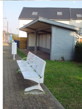
Une partie de l'équipement, voie 2