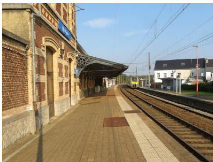
Le long du bâtiment, voie 1