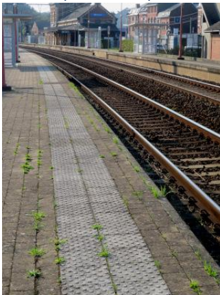
Revêtement des quais en clinkers + dalles podotactiles