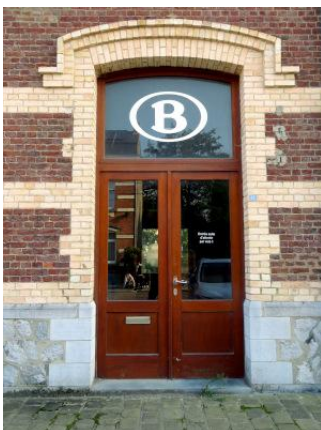
Côté Place, l'entrée du bâtiment renseigne une salle d'attente à laquelle on n'accède que depuis le quai