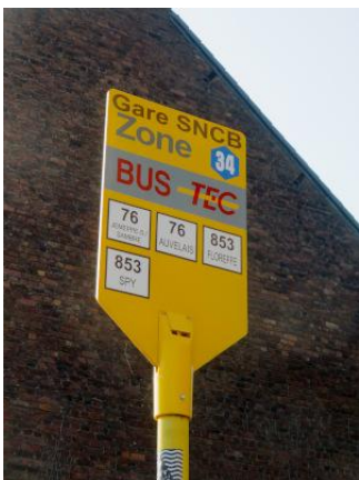
La plaque d'arrêt indique que les bus 76 et 853 circulant dans les deux sens s'arrêtent tous de l'autre côté de la Place