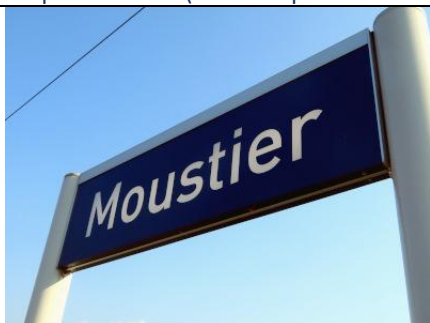
Le nom du point d'arrêt (nouvelle police de caractères)