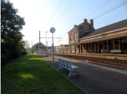
Vue générale des quais à hauteur du bâtiment de gare