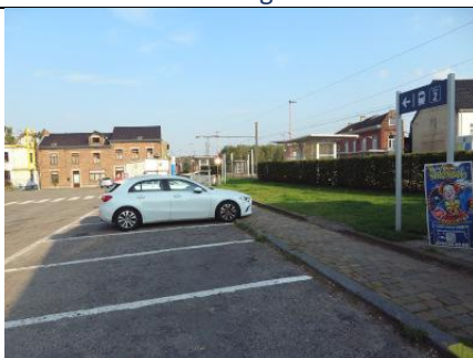
Places de stationnement sur la gauche du bâtiment de gare

Comme détaillé dans le tableau synthétique plus haut, il existe une cinquantaine de places de stationnement, dont une seule PMR, réparties entre la Place de la Gare et la rue du Viaduc de l'autre côté des voies. Le stationnement est gratuit. Les deux-roues pourront être remisés sous un abri situé latéralement sur le côté gauche du bâtiment de gare, à proximité de l'automate. Les bus du TEC desservent la gare de Moustier, mais l'embarquement et le débarquement se font désormais uniquement à partir de l'emplacement situé du côté opposé de la Place. L'emplacement situé au pied du bâtiment de gare présente toujours une plaque du TEC avec les numéros des lignes le desservant, et ce n'est qu'en regardant la valve des horaires de circulation qu'on prend connaissance que cet emplacement n'est plus desservi de manière définitive (sans message renvoyant les voyageurs de l'autre côté de la Place...).