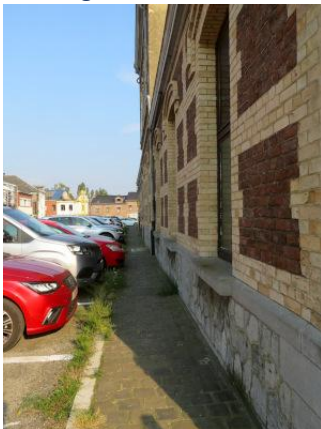
Le long du bâtiment, côté Place de la Gare