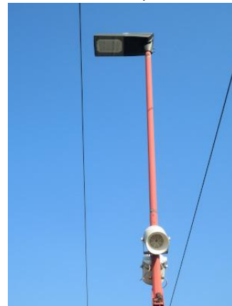
Nouvel éclairage LED