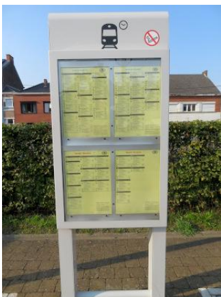
Les traditionnelles affiches jaunes des horaires