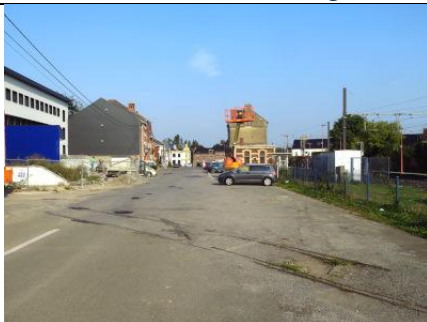
Place de la Gare, avec le bâtiment de gare dans le fond