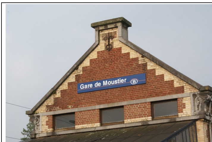
Panneau sur le bâtiment