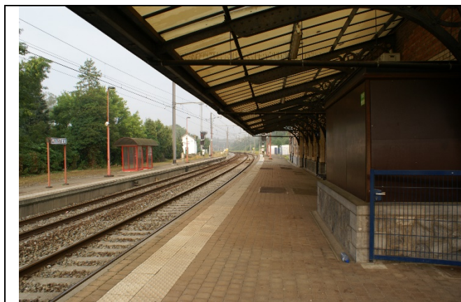
Quai partiellement couvert