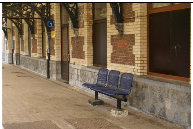
Sièges sur les quais et dans les abris

Des éclairages et des haut-parleurs sont disposés sur les quais.