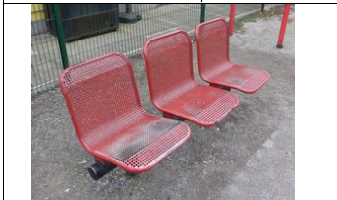
Sièges sur les quais