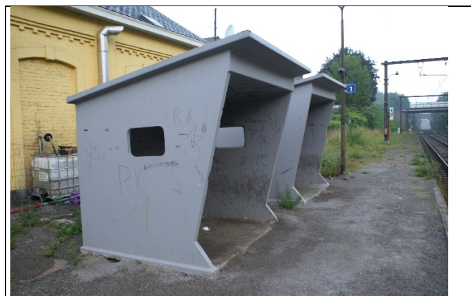
Abris sur les quais