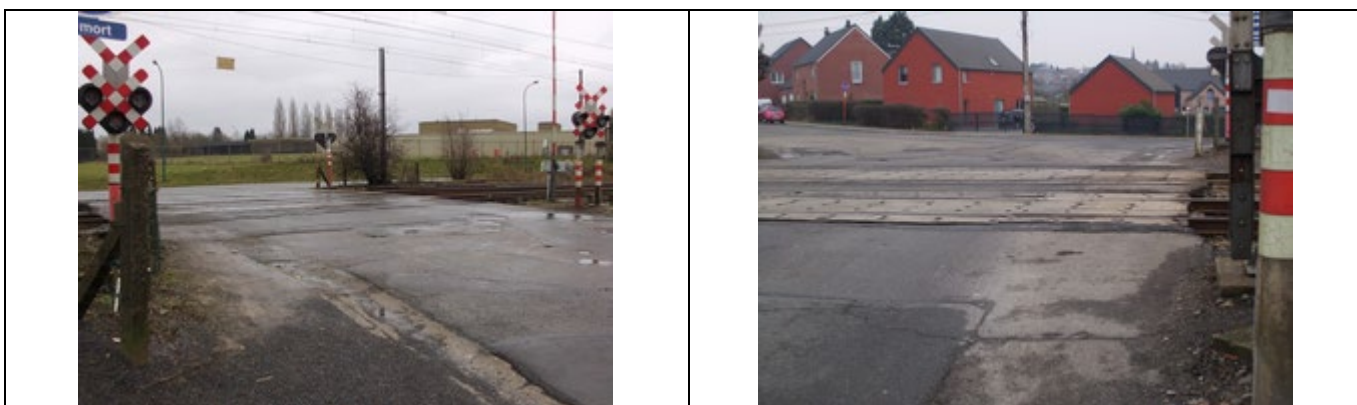
Passage à niveau