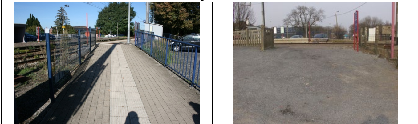
Accès aux quais