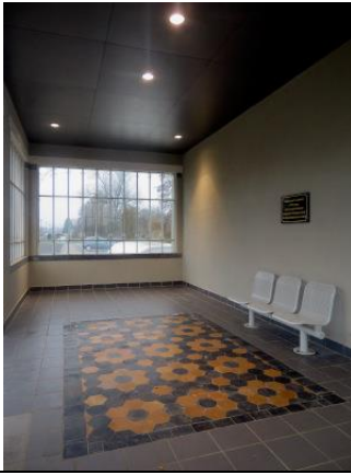
Intérieur de l'abri