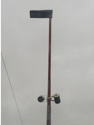
Eclairage LED et haut-parleurs de dernière génération