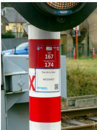
Le numéro du passage à niveau est indiqué sur les feux, ce qui est toujours utile en cas d'accident...