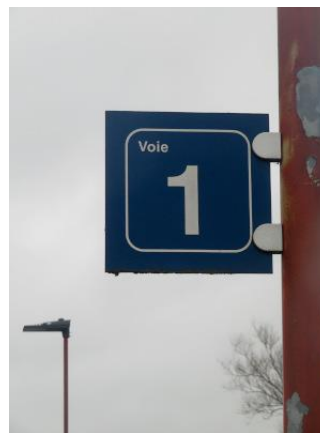
Un panneau superflu, puisqu'il n'y a qu'une voie en gare...