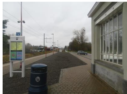
Cheminement à niveau du parking au quai