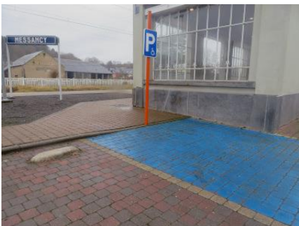
Tous les accès au point d'arrêt sont à niveau