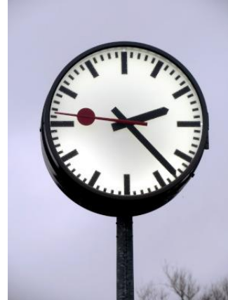
Horloge de quai à Messancy