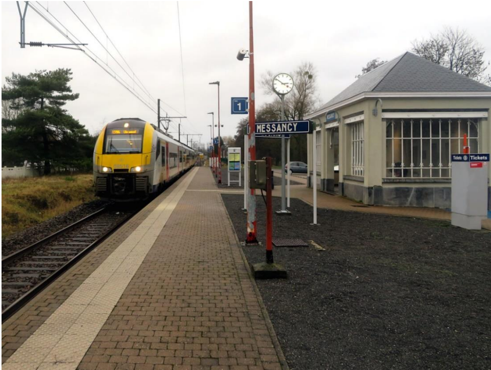
[La Desiro 08516 est au rendez-vous pour mener les voyageurs à Libramont via Virton en tant que train L5986 le 29 décembre 2023.]

La gare de Messancy a connu une histoire mouvementée qui tranche fortement avec la quiétude du point d'arrêt d'aujourd'hui. Alors que la Deuxième Guerre Mondiale connaissait ses derniers dénouements, un train de munitions de l'allié américain explosait en gare, causant des dégâts impressionnants dans un rayon fort important 4 . En avril 1976, l'incendie du bâtiment de gare, déjà fermé aux voyageurs depuis près d'une décennie, augurait de la ruine qui survint en juin 1984, lorsque la desserte de Messancy fut supprimée 5 dans le cadre des mesures d'économie du funeste Plan IC/IR de la SNCB.