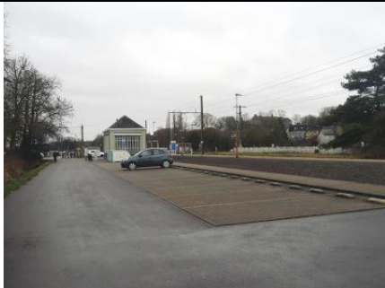
Stationnement pour voitures le long du quai...