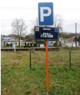
Confirmé par ce panneau