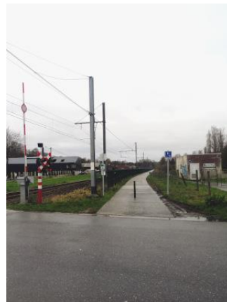
Piste cyclopédestre à hauteur du passage à niveau