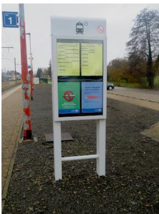
Le panneau d'information abritant les affiches jaunes