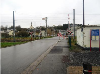
La rue de la Gare à Messancy, avec le passage à niveau n°174