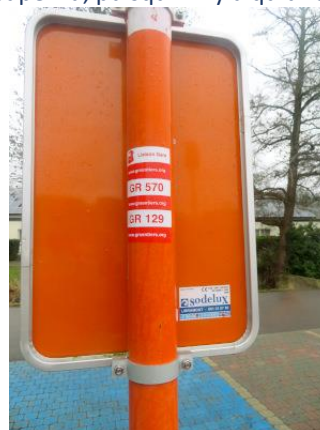
Trouver les numéros des sentiers de promenade a été un peu plus compliqué