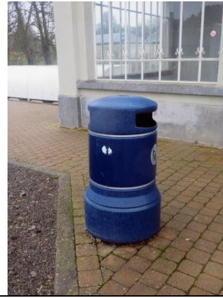
Une poubelle de quai d'ancien modèle