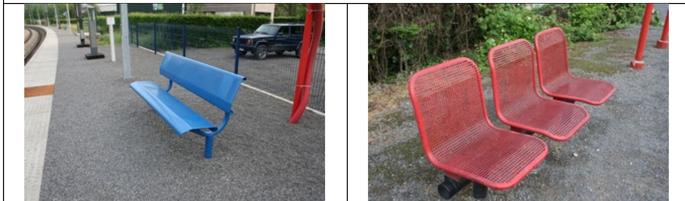
Sièges sur les quais