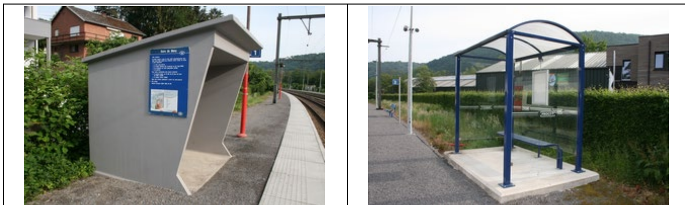
Abris sur les quais