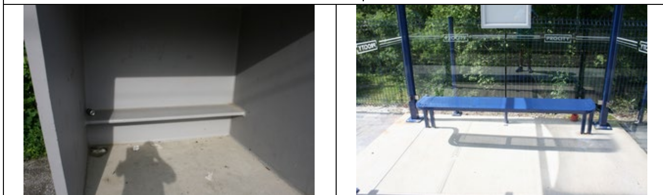
Bancs dans les abris