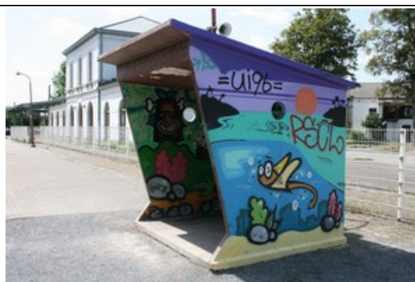
Abris sur le quai