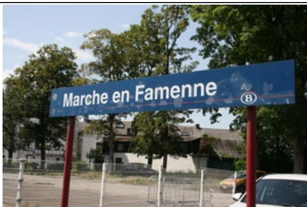
Panneaux sur le quai