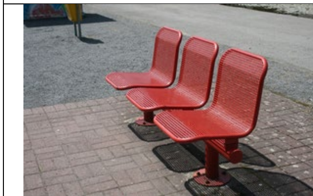
Sièges sur le quai

Des éclairages et des haut-parleurs sont disposés sur le quai.