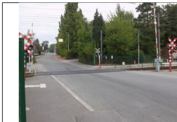
Passage à niveau