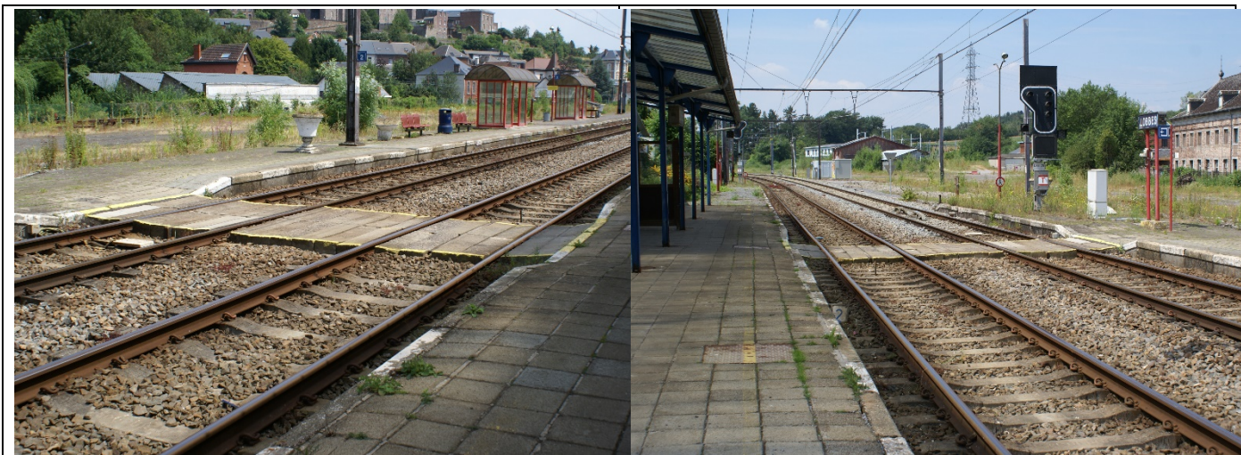
Traversée des voies