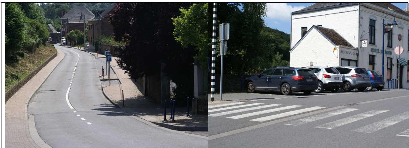
Possibilités de stationnement à proximité