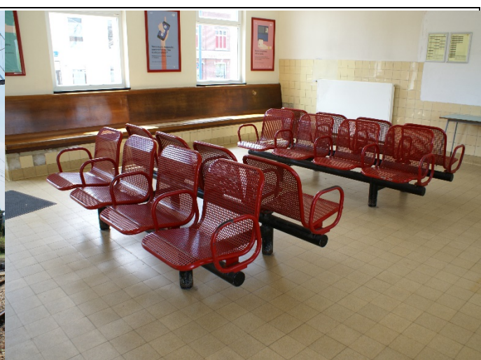
Sièges salle d'attente