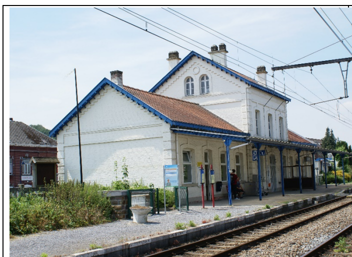
Quai 1 couvert