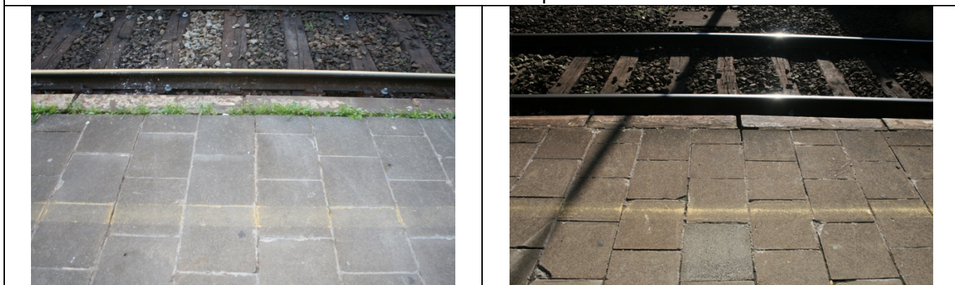
Absence de dalles podotactiles