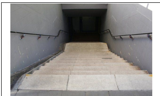
Escaliers d'accès au couloir sous-voies