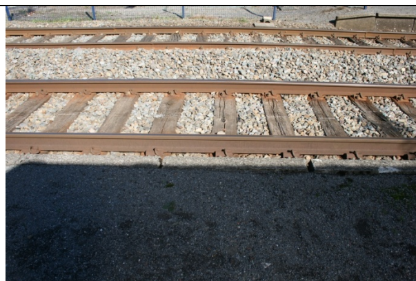
Absence de dalles podotactiles