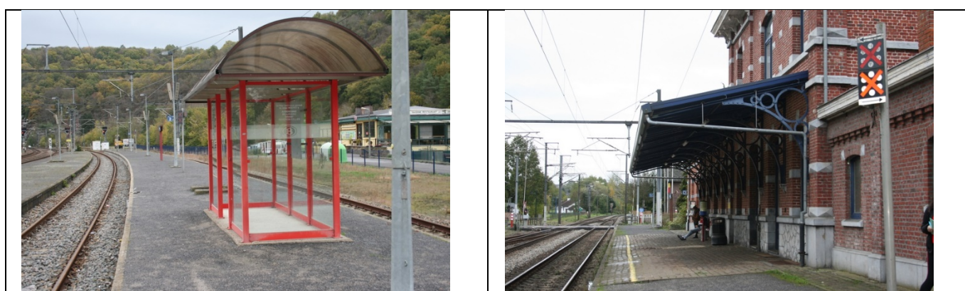
Abri sur le quai