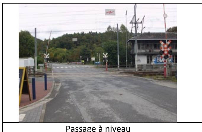
Passage à niveau