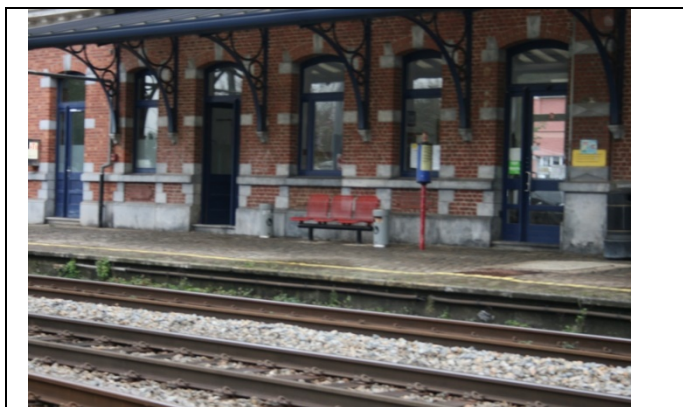
Sièges dans les abris

Des éclairages et des haut-parleurs sont disposés sur les quais.