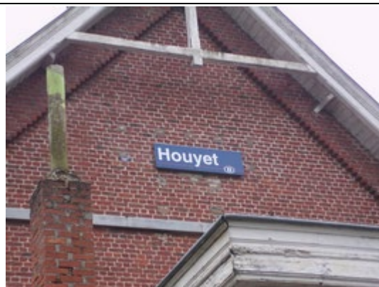
Panneau sur le bâtiment