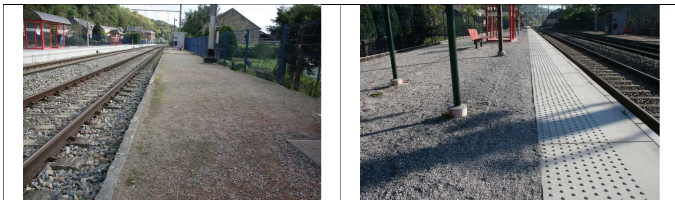
Le revêtement des quais