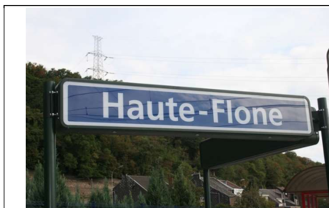
Panneaux de dénomination éclairés