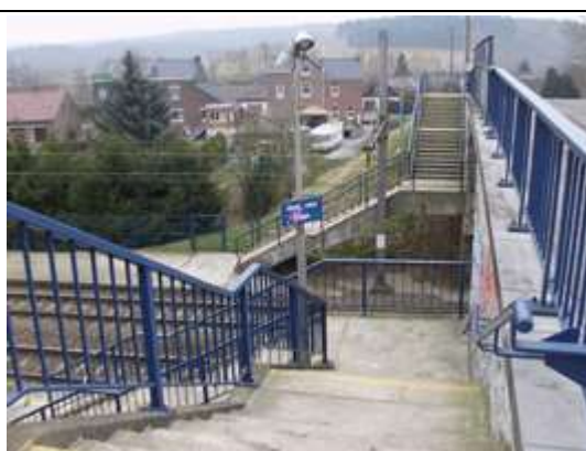
Escaliers d'accès aux quais