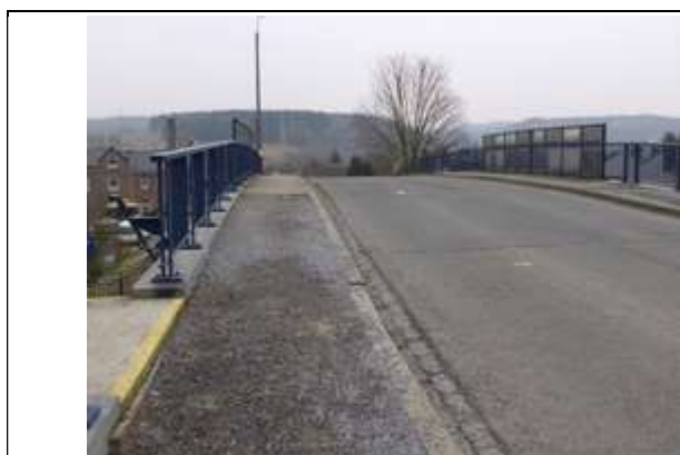
Pont au-dessus des voies