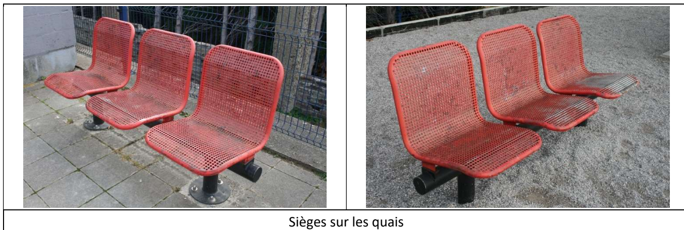
Sièges sur les quais

Des éclairages et des haut-parleurs sont disposés sur les quais.