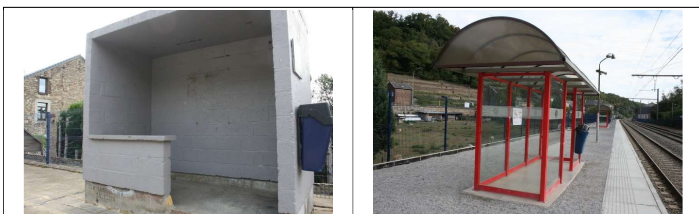
Abris sur les quais