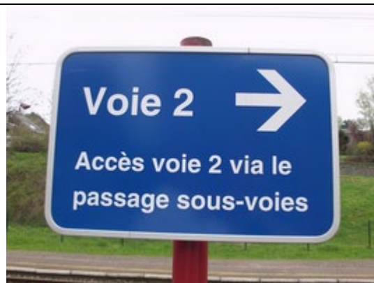
Indication du couloir sous-voies