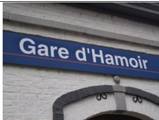
Panneaux sur le bâtiment