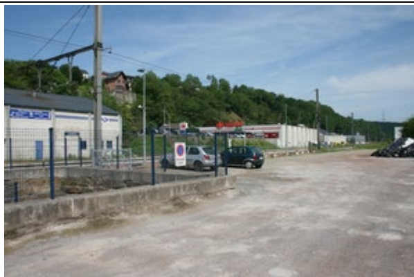
Parking du PANG