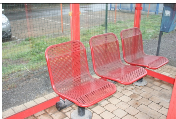
Sièges dans les abris