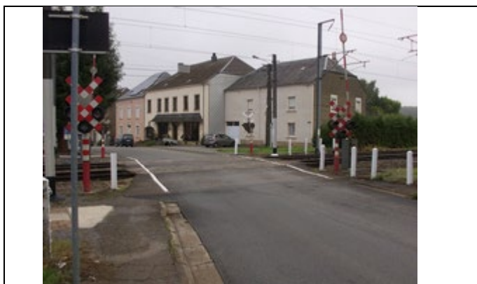
Passage à niveau