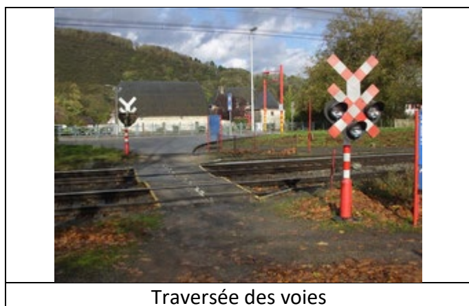
Traversée des voies