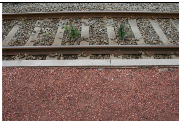
Absence de dalles podotactiles