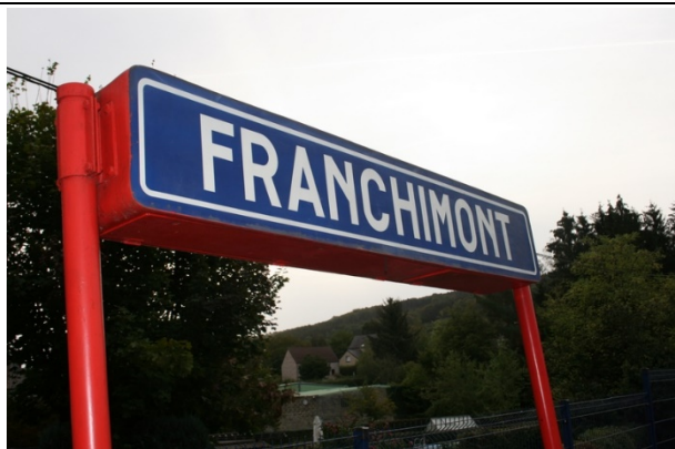
Panneaux sur le quai