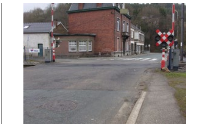
Passage à niveau