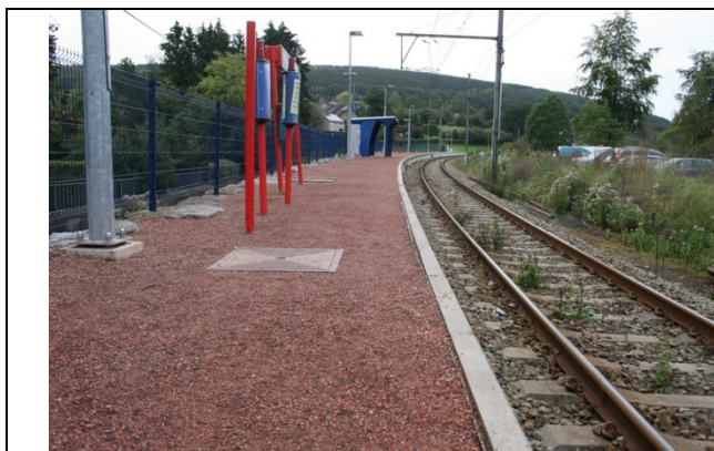
Revêtement du quai