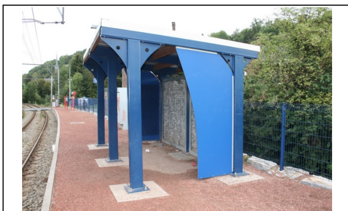
Abri sur le quai

Des éclairages et des haut-parleurs sont disposés sur le quai.