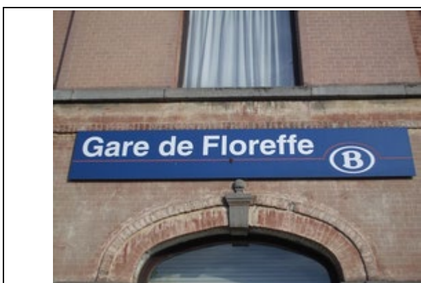
Panneau sur le bâtiment