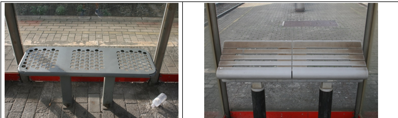
Sièges dans les abris