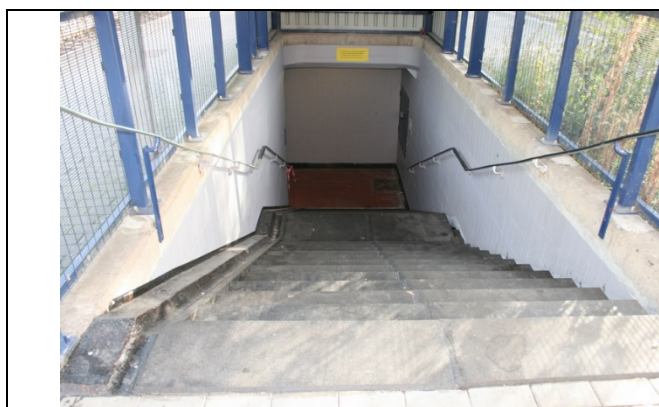
Escaliers d'accès aux quais