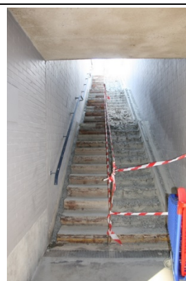
Escaliers d'accès aux quais