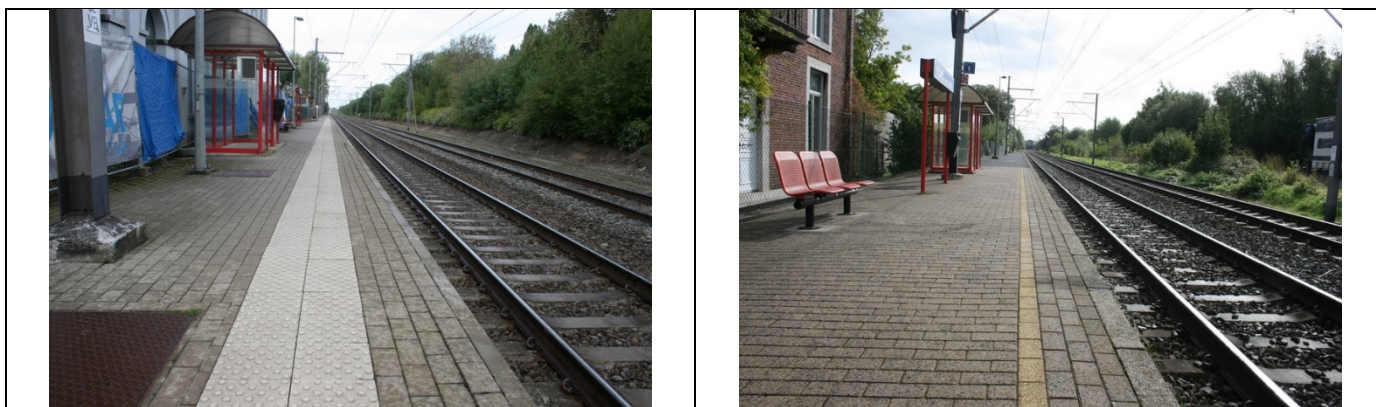
Revêtement des quais