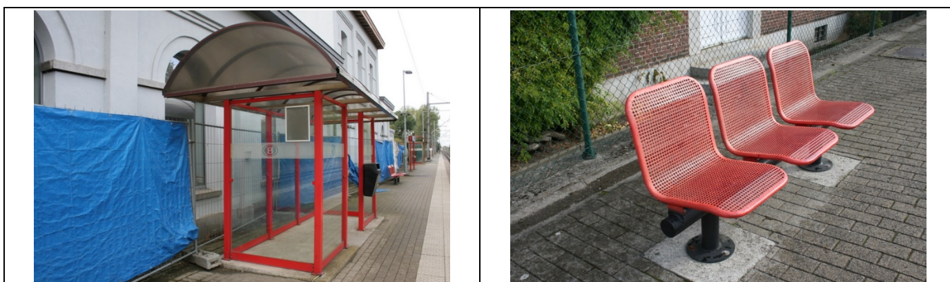
Abris sur les quais