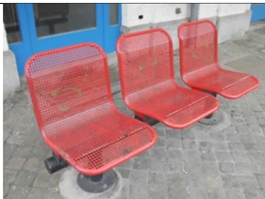
Sièges sur les quais

Des éclairages et des haut-parleurs sont disposés sur les quais.