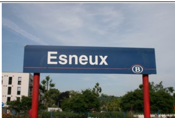
Panneaux sur les quais