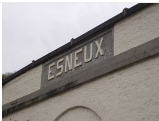
Panneaux sur le bâtiment