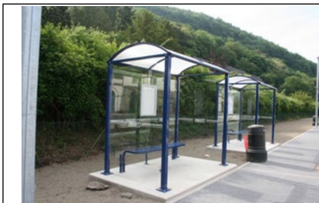
Abris sur les quais