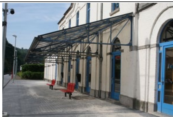
Quai partiellement couvert