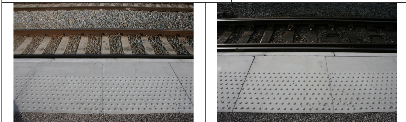
Présence de dalles podotactiles