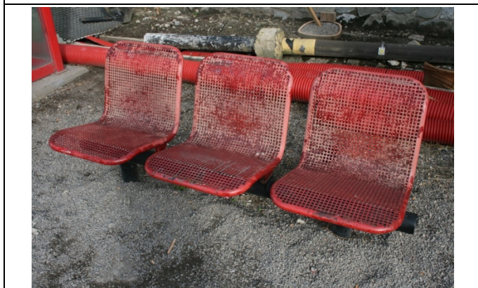
Sièges sur les quais