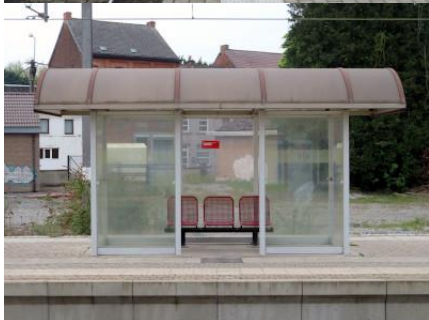
Voie 2 : abri de quai (type « Salzinnes » repeint) avec banc