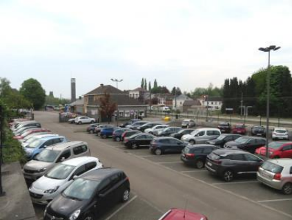
Parking SNCB gratuit de 78 places