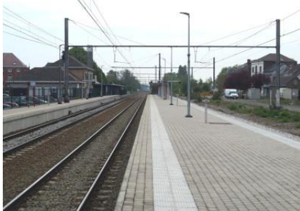
Vue du quai séparant les voies 2 et 3

Bilan : Le nombre de places assises sur le quai de la voie 2 est fort insuffisant au regard de l'affluence en heures de pointe. L'une ou l'autre poubelle en plus ne serait pas un luxe non plus.