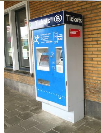
Automate extérieur sous abri en parfait état