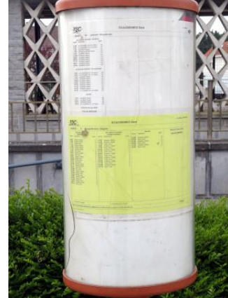
Correspondances (?) avec les bus du TEC