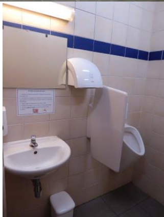
Propreté impeccable des toilettes hommes