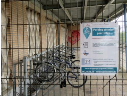
Dix-huit places couvertes pour vélos