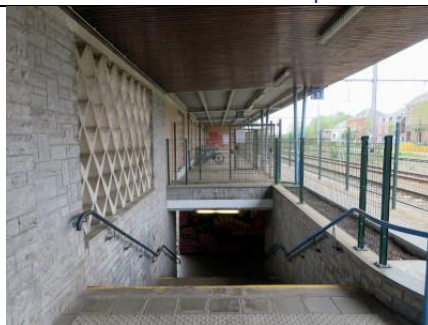
Accès au couloir sous voies depuis la voie 1