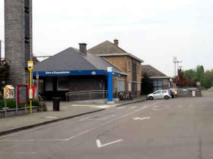
Le bâtiment de gare est situé Plateau de la gare