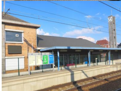
Abri pour voyageurs et équipement voie 1 (note : photo du 24/04/2022)