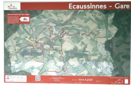
L'infographie de l'asbl Tous à Pied proposant des itinéraires de balade, disposée contre le bâtiment de gare.