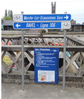
RAVeL à proximité immédiate...