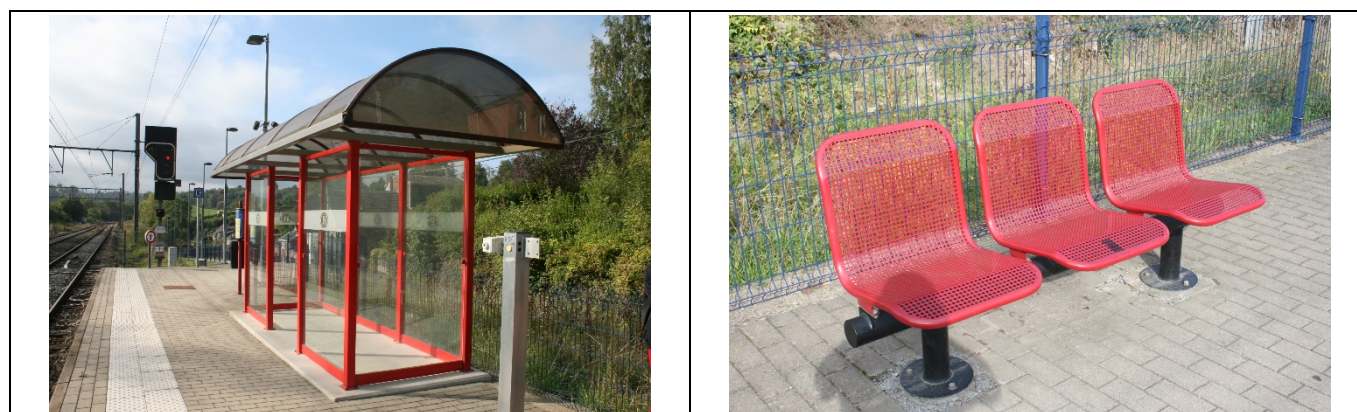
Abris sur les quais