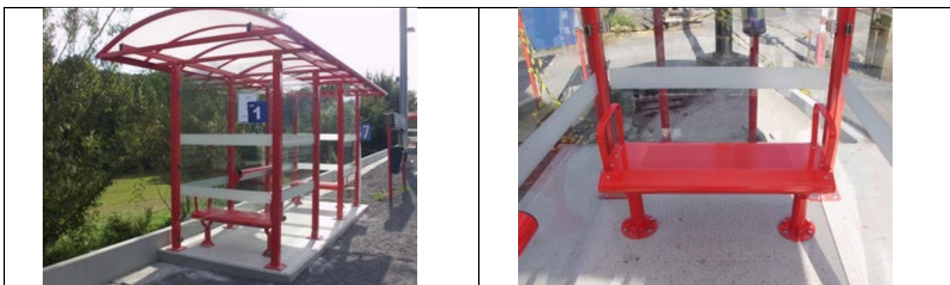
Abris sur les quais