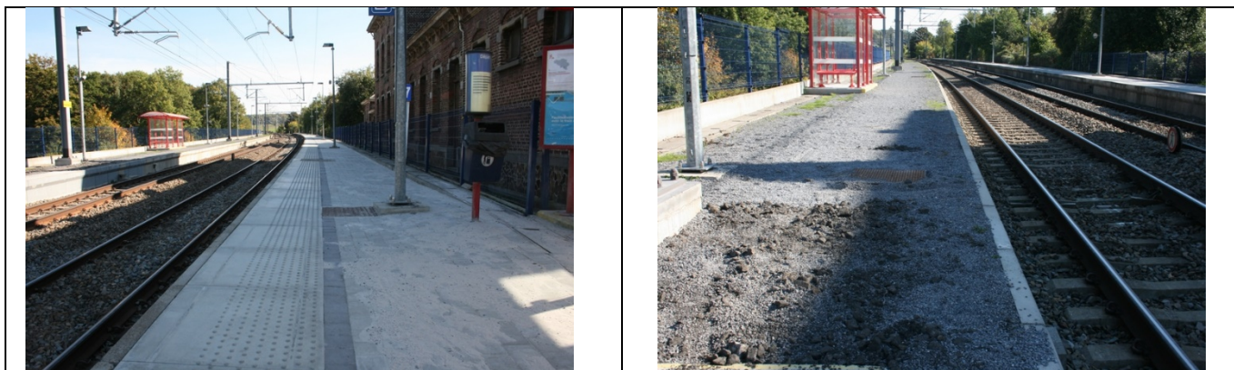
Revêtement des quais