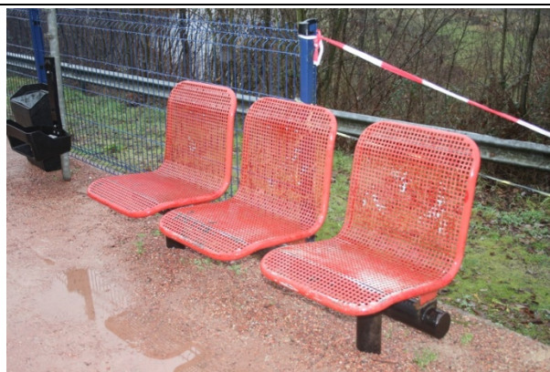
Sièges sur le quai

Des éclairages et des haut-parleurs sont disposés sur le quai.