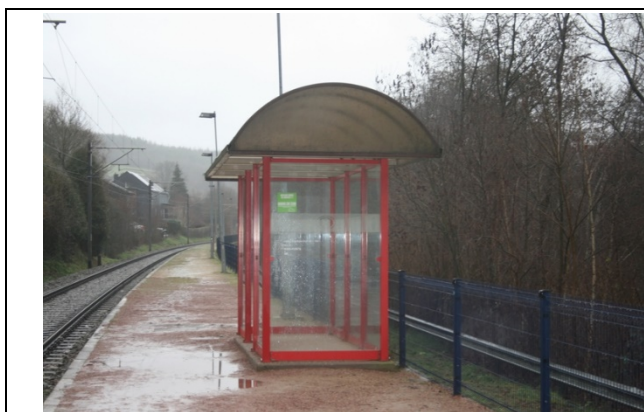
Abri sur le quai