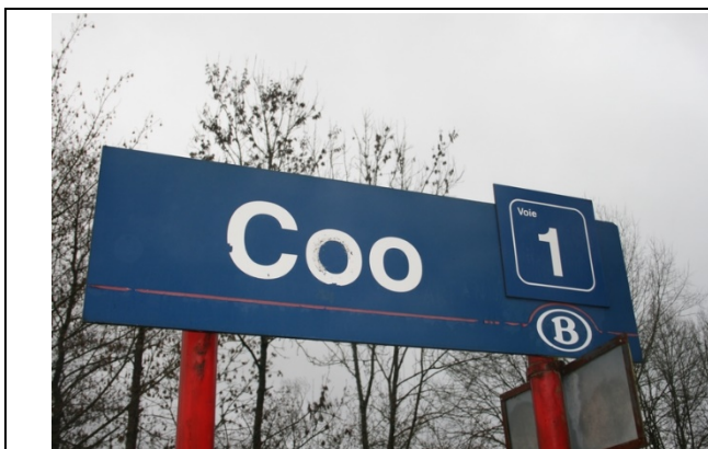
Panneaux sur les quais