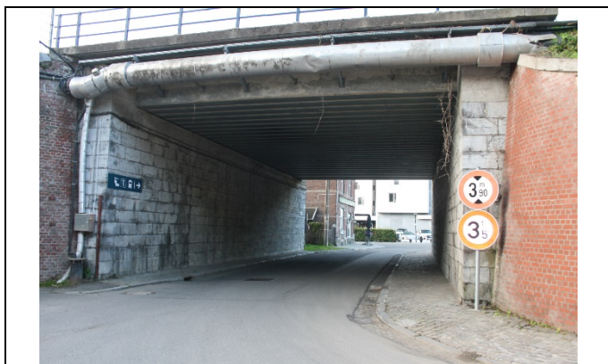
Pont sous les voies