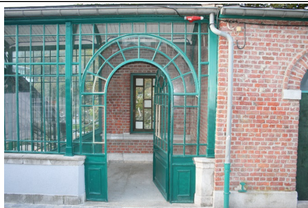
Bancs dans les abris