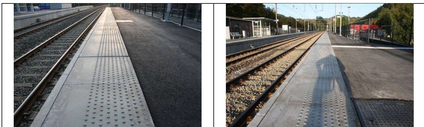
Revêtement des quais