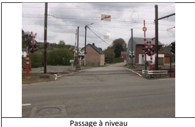
Passage à niveau