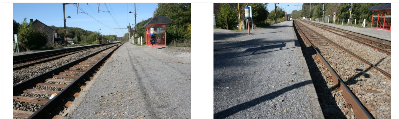
Revêtement des quais