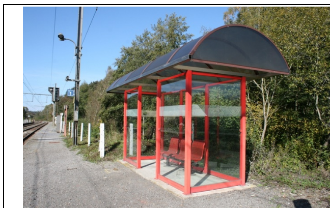
Abris sur les quais