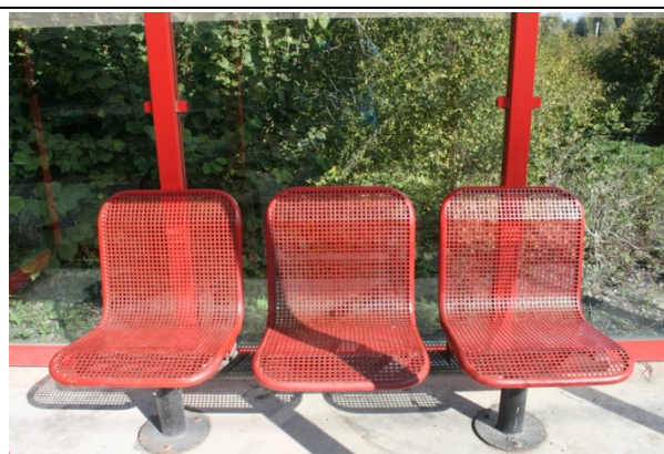
Sièges sur le quai