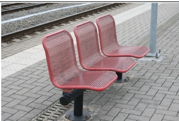
Sièges sur les quais

Des éclairages et des haut-parleurs sont disposés sur les quais