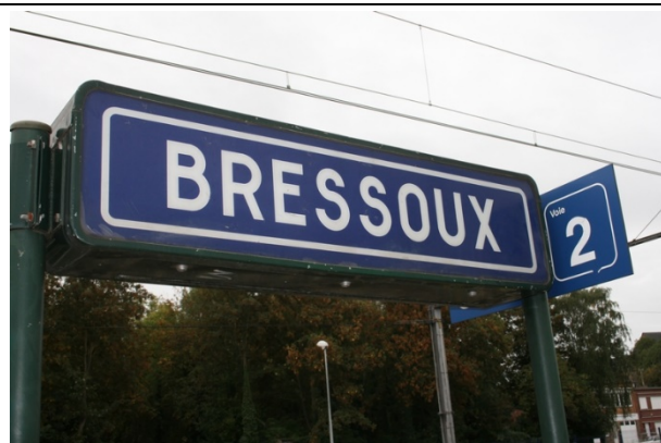
Panneaux sur les quais