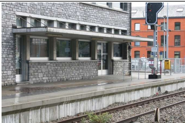
Quai partiellement couvert