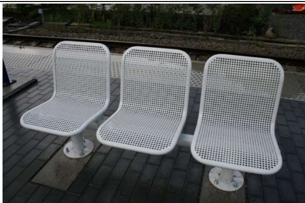
Sièges sur les quais