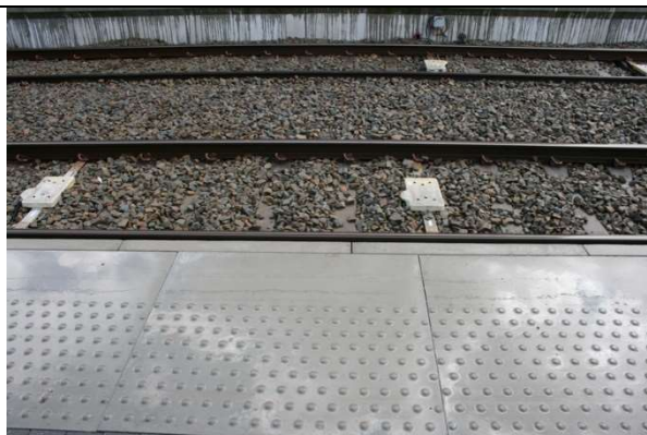
Présence de dalles podotactiles