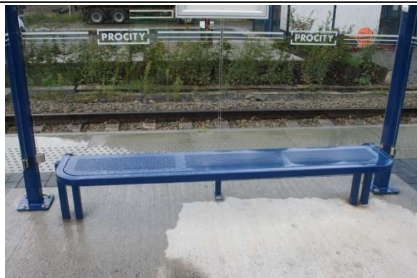
Sièges dans les abris