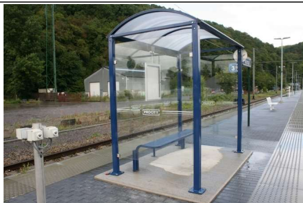
Abris sur les quais