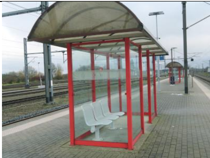
Un des sept abris de quais, avec banc à l'intérieur