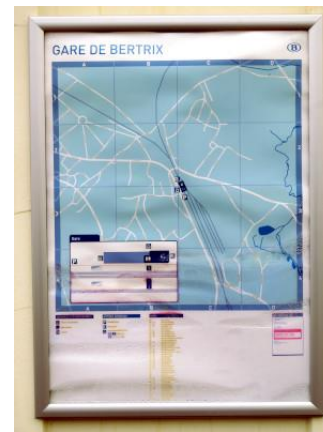
Devant la gare, une vieille affiche permet aux voyageurs de positionner la gare dans le plan communal