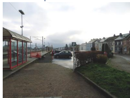
Le même accès vu à hauteur du quai