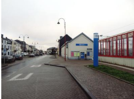
Abords de la gare en sortant du parking