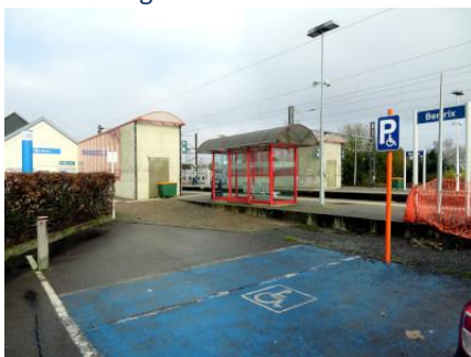
Accès à niveau depuis la place de stationnement PMR