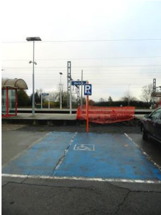
Une seule place de stationnement PMR