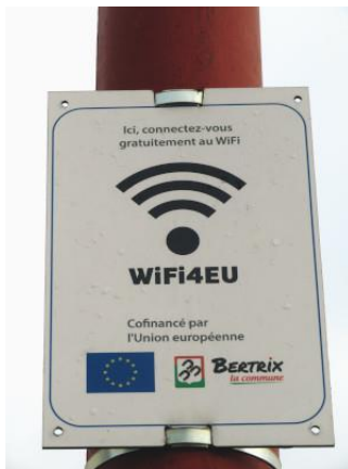
Juste devant la gare, panneau annonçant la présence d'un WiFi gratuit