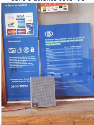
Salle d'attente côté rue