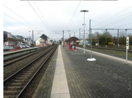
Vue d'ensemble des quais