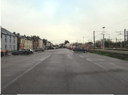
Le parking communal de la gare, pris à mi-longueur