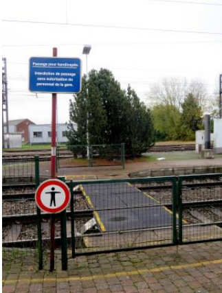
Traversée (accompagnée) à niveau pour les PMR devant accéder à l'autre quai