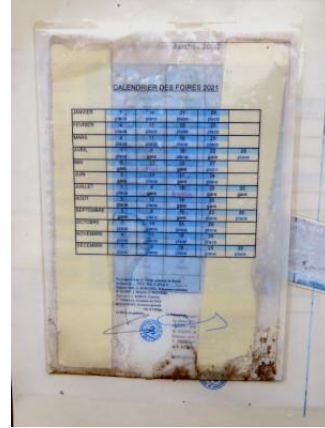
Affiche indiquant l'horaire des « foires » en 2021