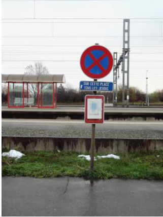
Interdiction de stationner sur la place le jeudi