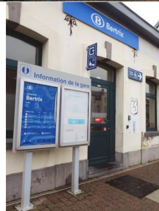
Accès par la salle d'attente