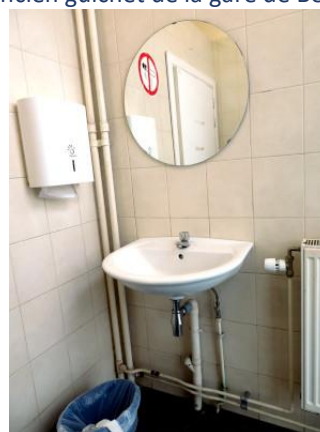
L'ancien guichet de la gare de Bertrix