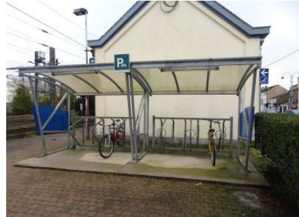
Abri pour vélos adossé au bâtiment de gare