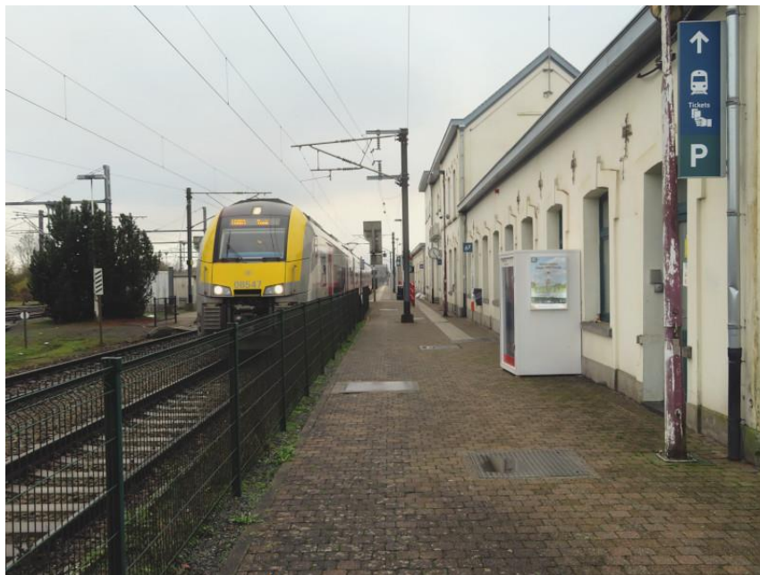
La Desiro 08547 démarre de la voie 1 à Bertrix en mission L6083 à destination de Dinant et Namur

Cette fiche est donc la toute première réalisée par navetteurs.be à Bertrix. Tant l'infrastructure que l'équipement du point d'arrêt répondent aux standards modernes. La SNCB pourrait ajouter quelques places assises sur les quais et ajouter un écran indiquant les départs dans la salle d'attente. La couleur rouge des équipements de naguère reste bien présente. A quand le coup de gris clair et les poubelles de dernière génération?