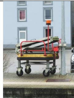
Rampe mobile pour PMR, disposée le long de la voie 1