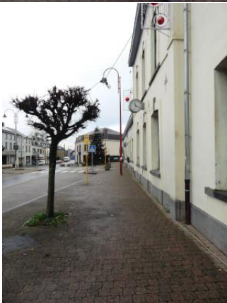
Le long du bâtiment côté rue