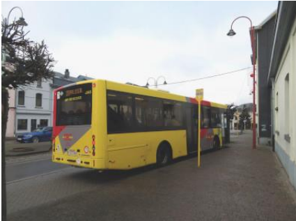
Le bus 66 au départ de la gare de Bertrix