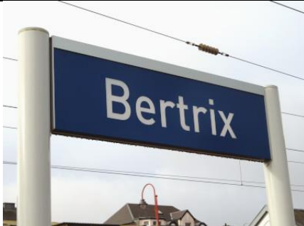
Le nom de la gare est affiché çà et là sur les quais