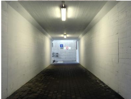
Le couloir sous voies à Bertrix