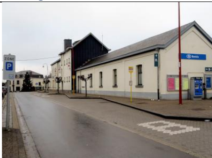
Vue générale du bâtiment côté rue