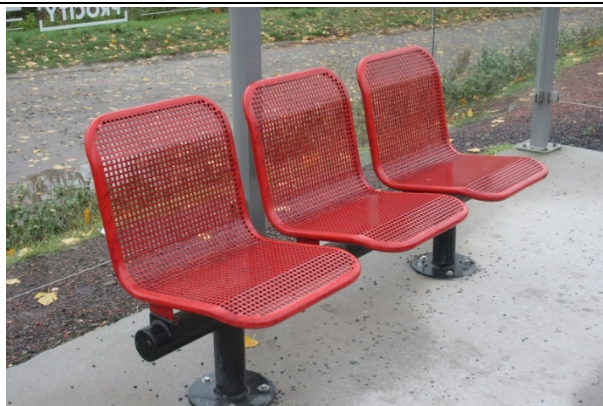
Sièges dans les abris