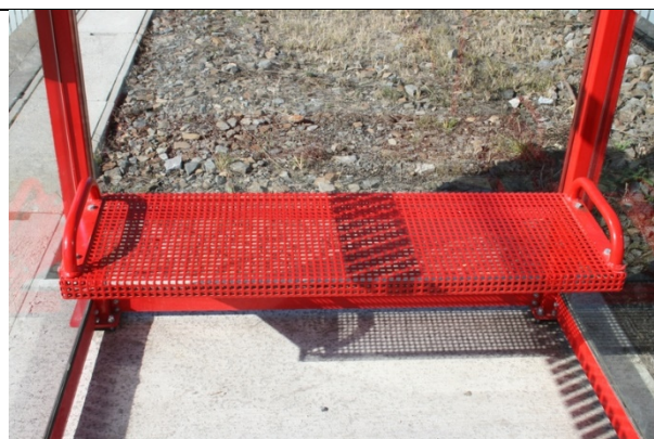
Sièges dans les abris