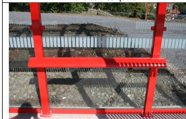
Barres d'appui dans les abris